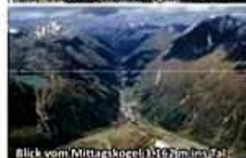
Blick vom Mittagskogel 3.162 m ins Pitztal