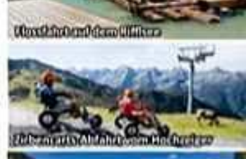
Wanderort mit dem Liftkart