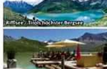
Riffelsee - Tirols höchster Bergsee