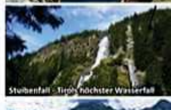
Stuibenfall - Tirols höchster Wasserfall