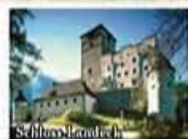
St. Blasius Landeck

(Änderungen im Alternativprogramm sind vorbehalten! Bei notwendigen Änderungen wird das zuvor gebuchte Programm mit dem neuen Programm verrechnet oder erstattet!)