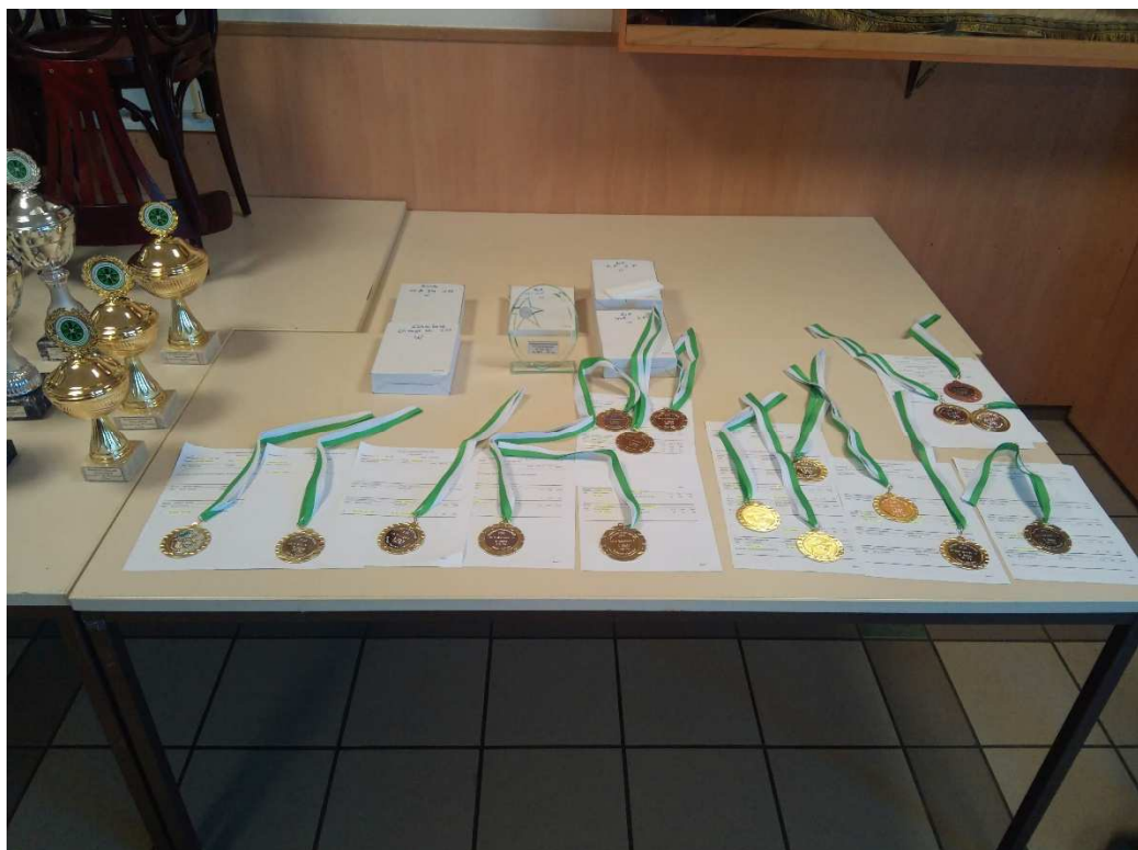
Foto Auszeichnungen Winterkämpfe